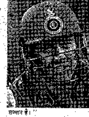
A portrait of a man, likely a tennis player or official.

जोड़ी ने फ्रेंच ओपन टैबल टेनिस का महिला युवल सेमी के दूसरे दौर में प्रवेश किया।