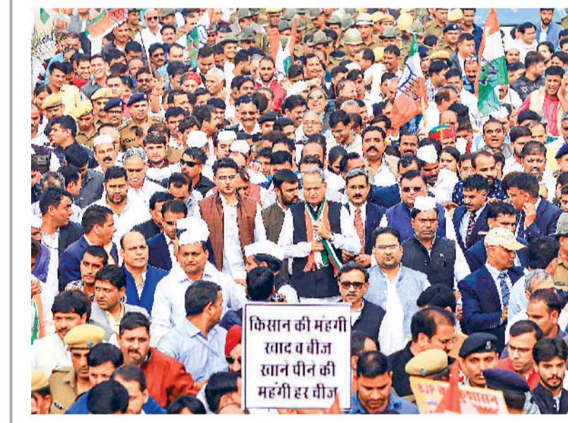
जयपुर : केंद्र सरकार की जनविरोधी नीतियों तथा सोनिया गांधी और उनके परिवार की एस्प्रीजी सुरक्षा हटाए जाने के विरोध में मुख्यमंत्री अशोक गहलोत एवं प्रदेश कांग्रेस अध्यक्ष सचिन पायलट सहित पार्टी नेताओं एवं कार्यकर्ताओं ने पार्टी के प्रदेश मुख्यालय से राजभवन तक विरोध रैली निकली।